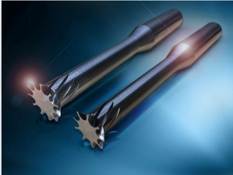
BC/BC-C シリーズ (ウラ面取り加工用カッター)